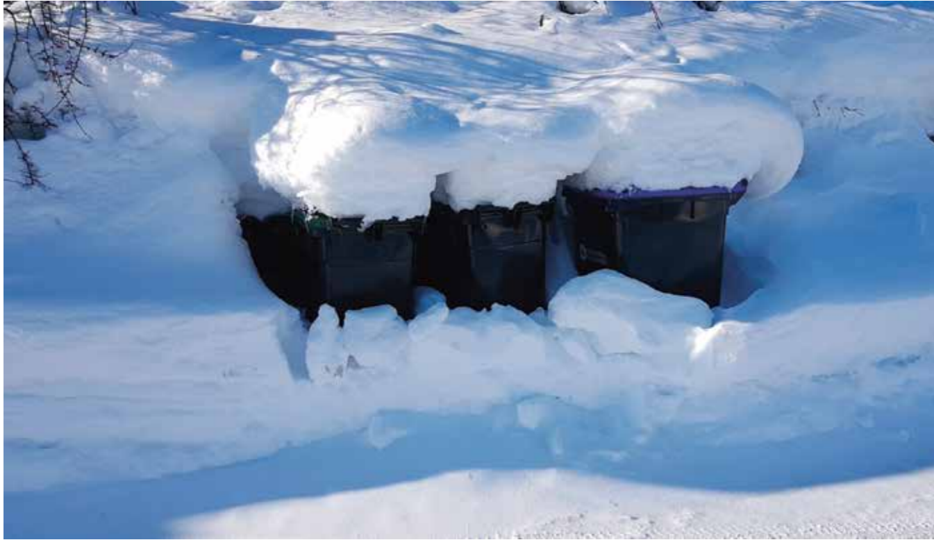
MØTER RENOVATØRENE NEDSNØDDE DUNKER, MÅ DE LA DUNKENE STÅ UTØMT.